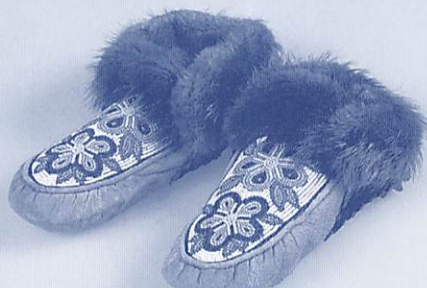
モカシン/グイッチン(アサバスカインディアン) フロ=レンス=ニューマン作