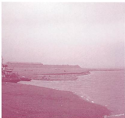
▲カムチャツカ西海岸パラナ川河口の現状 かつてこの付近で日本人漁業者がサケ漁を行っていた。