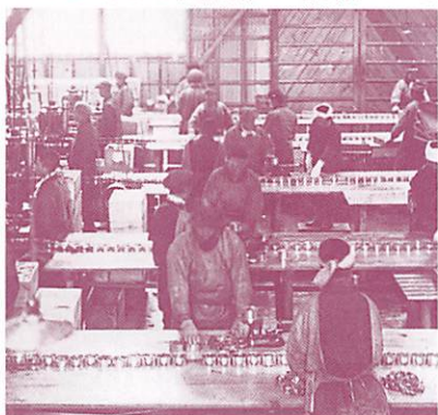
▲北洋漁業時代のサケ缶詰工場