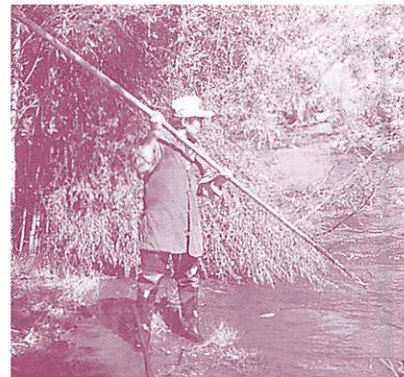
▲鉤鉗をかまえるエヴェンの男性／カムチャツカ州アナブガイ村

このような多くの恵みをあたえてくれるサケ類に対し、北方の人びとは緊密な関係を保つように努め、豊漁を祈願する儀礼や、自然を支配する<神>・<主>に対する信仰がみられた。とくにアイヌ社会では、初漁儀礼や叩き棒の使用法にみられるようにサケを「神の魚」と捉える信仰が発達していた。