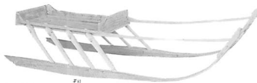
男性用トナカイ橇