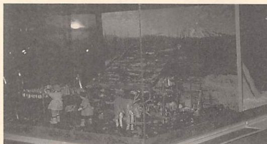
ウイльтаの夏の住居の模型

住居模型は実際の1/10の大きさと、オタスに移住する前の夏と冬の生活の様子をあらわしています。